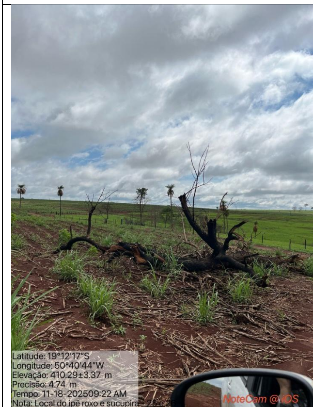
Figura 04: Foto in loco.