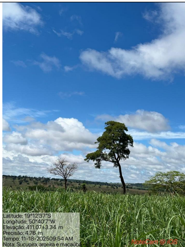
Figura 09: Foto in loco (Arquivo pessoal, 2025).