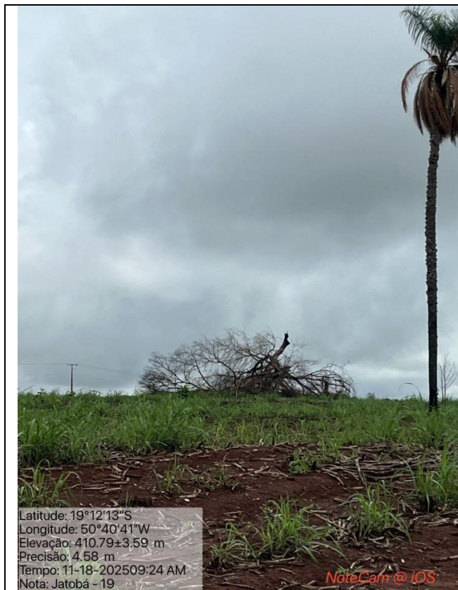
Figura 08: Foto in loco (Arquivo pessoal, 2025).