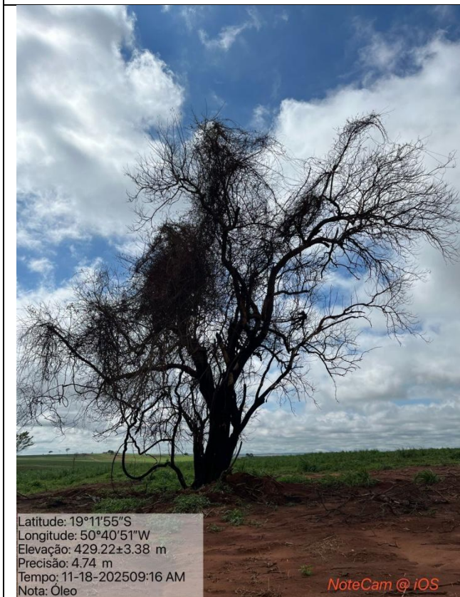
Figura 02: Foto in loco.