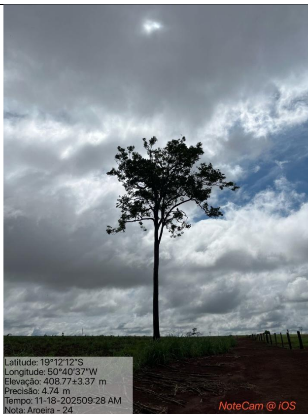
Figura 05: Foto in loco.