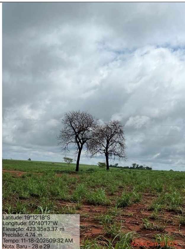
Figura 03: Foto in loco.