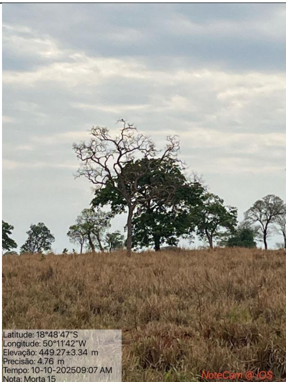
Figura 06: Foto in loco (Arquivo pessoal, 2025).