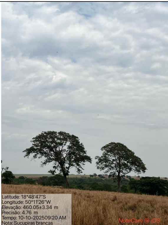
Figura 04: Foto in loco.