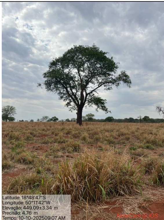
Figura 05: Foto in loco (Arquivo pessoal, 2025).