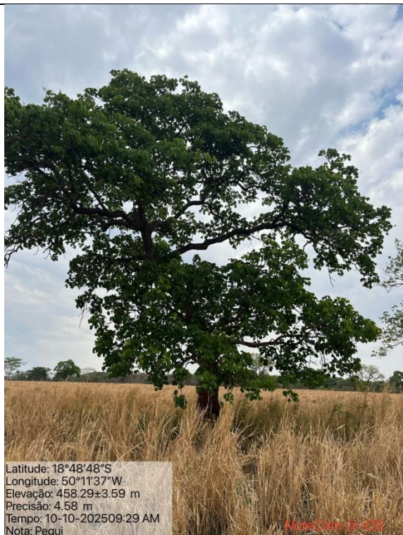
Figura 02: Foto in loco da árvore pequizeiro ( Caryocar brasiliense ) que não foi autorizada o corte.