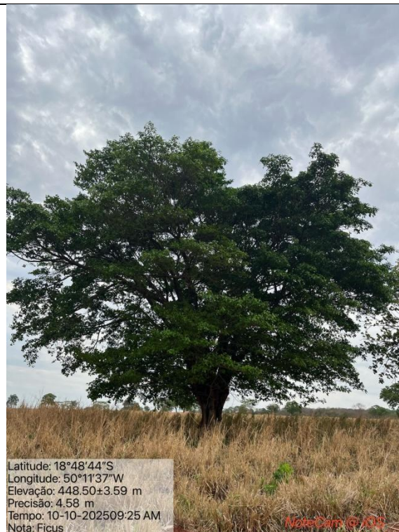
Figura 03: Foto in loco (Arquivo pessoal, 2025).