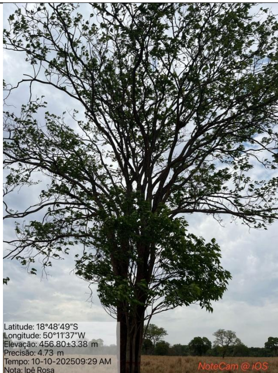
Figura 07: Foto in loco (Arquivo pessoal, 2025).