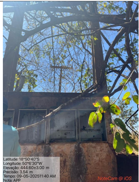
Figura 03: Foto in loco.