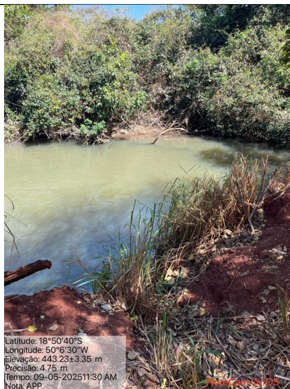
Figura 07: Foto in loco.