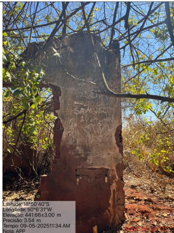
Figura 05: Foto in loco.