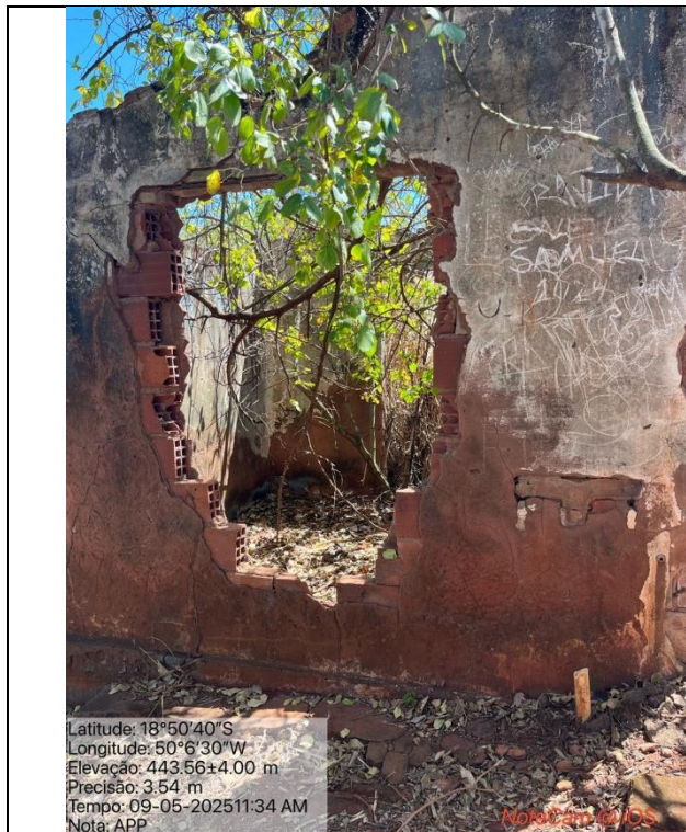
Figura 04: Foto in loco (Arquivo pessoal, 2025).