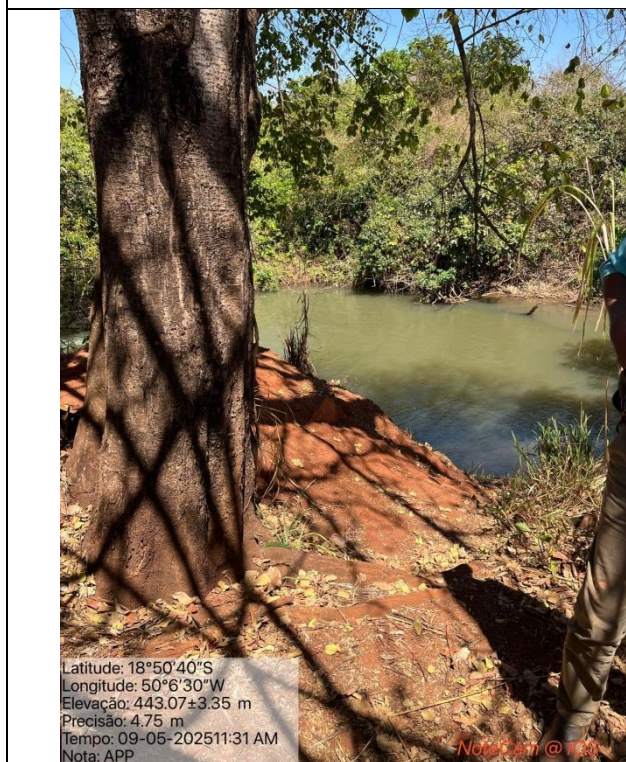
Figura 06: Foto in loco.