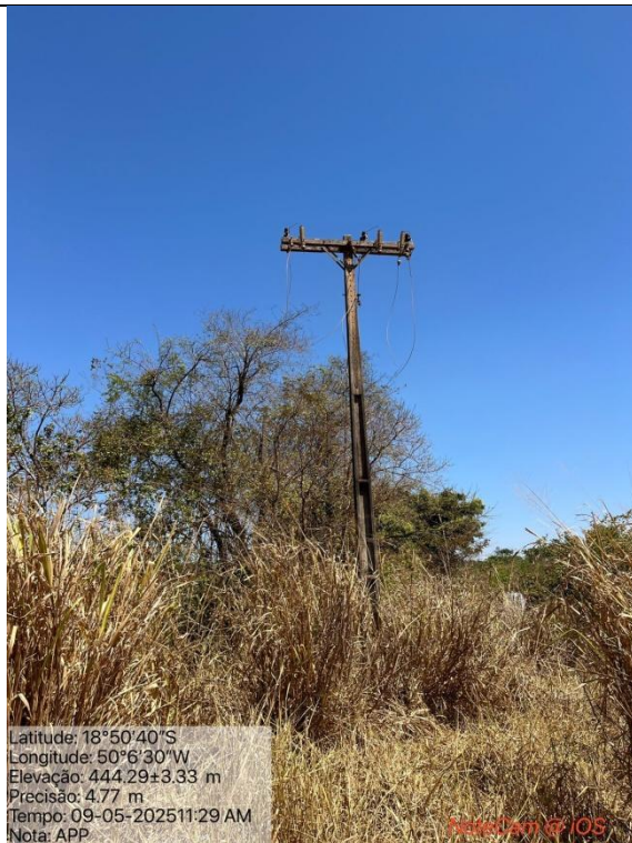
Figura 02: Foto in loco (Arquivo pessoal, 2025).