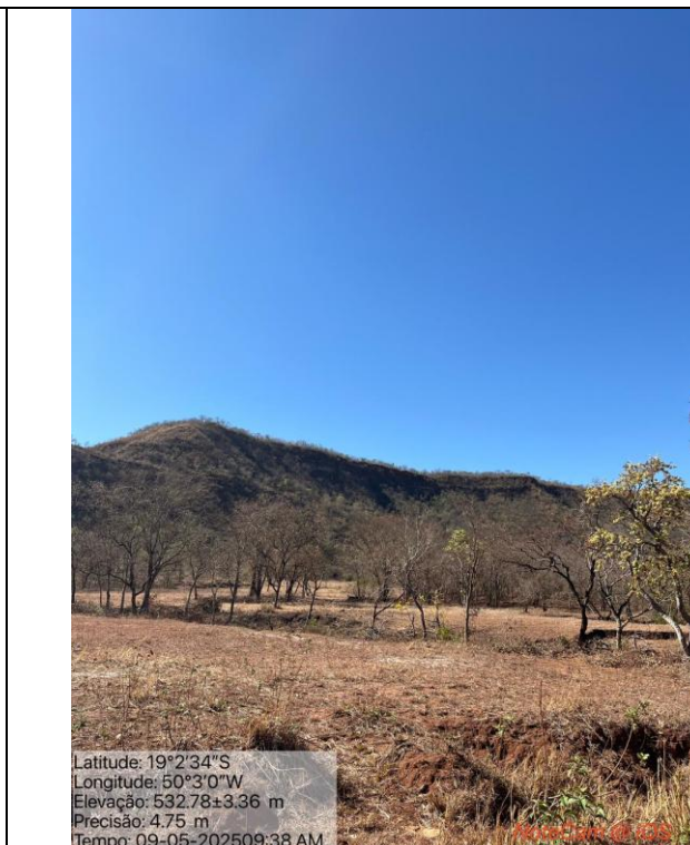
Figura 05: Foto in loco.