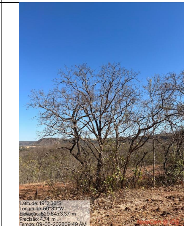
Figura 07: Foto in loco.