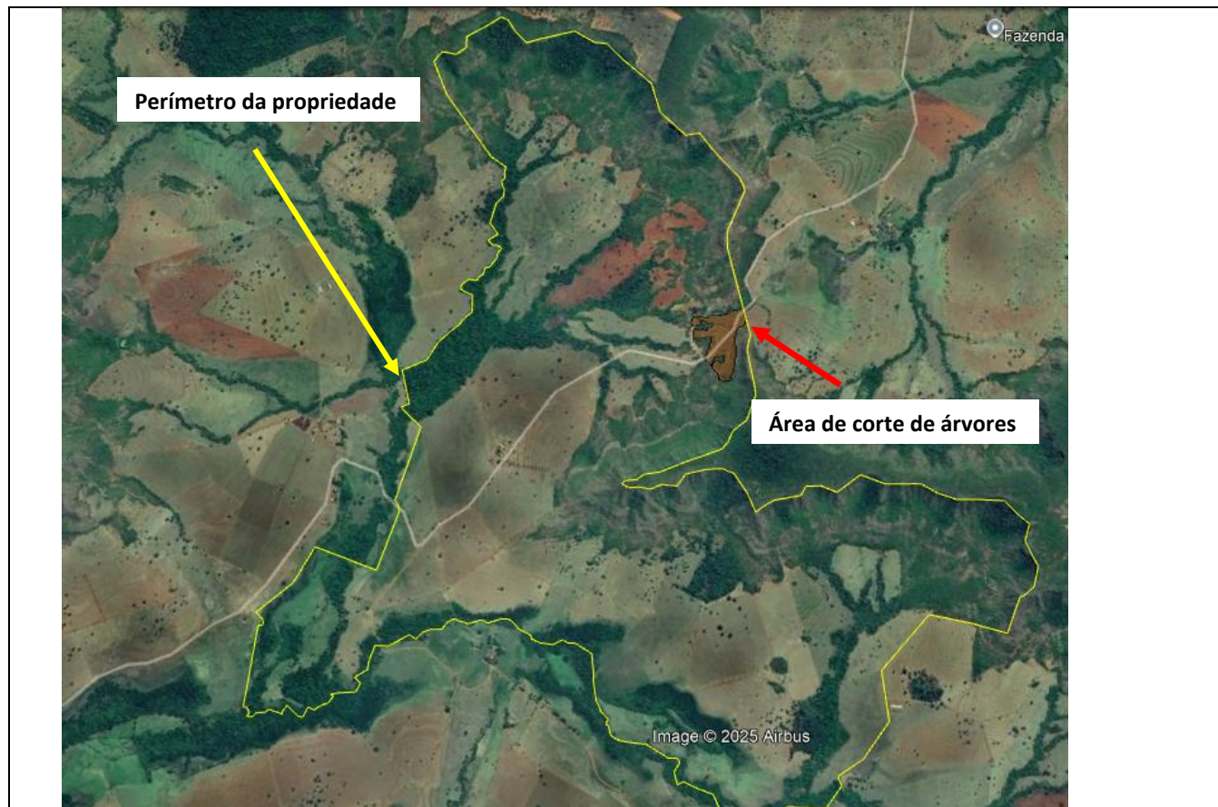
Figura 01: Área propriedade (Google Earth, 2025).