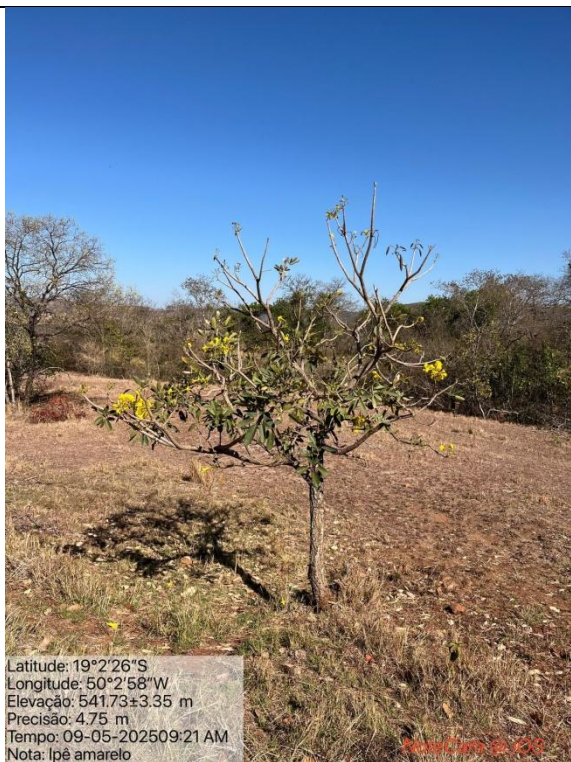
Figura 10: Foto in loco da árvore Ipê Amarelo – Handroanthus albus que não foi autorizada o corte.