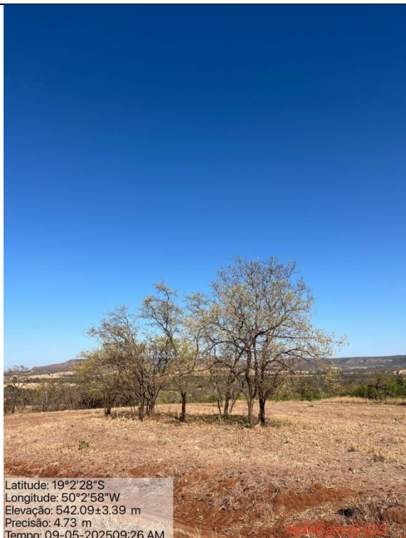
Figura 02: Foto in loco.