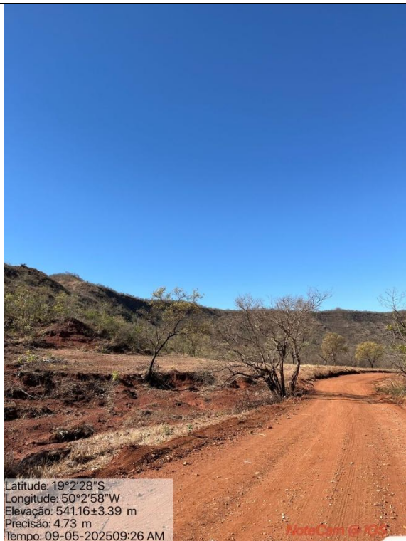
Figura 08: Foto in loco (Arquivo pessoal, 2025).