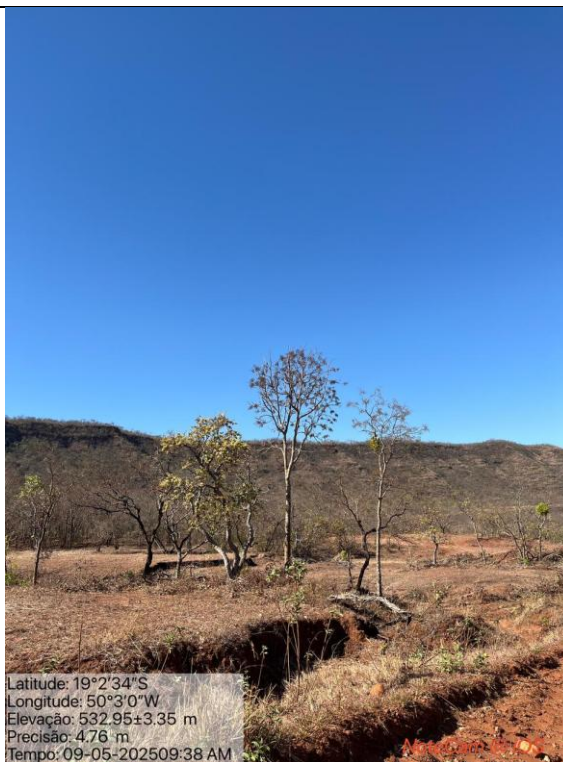
Figura 11: Foto in loco da árvore Ipê Amarelo – Handroanthus albus que não foi autorizada o corte.