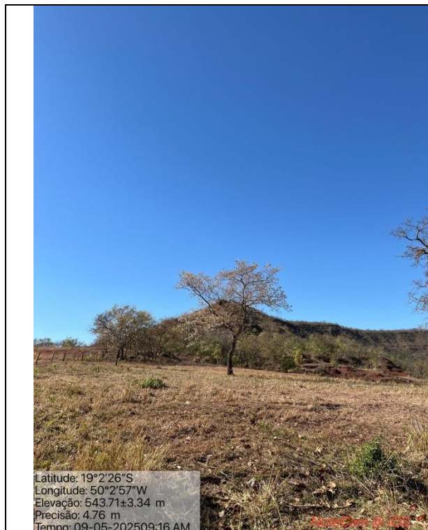
Figura 04: Foto in loco.