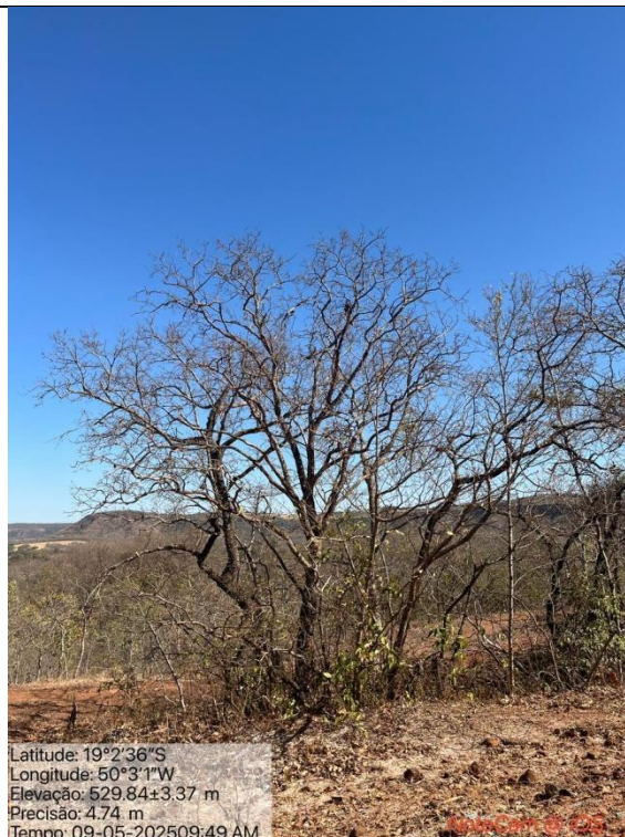
Figura 03: Foto in loco.