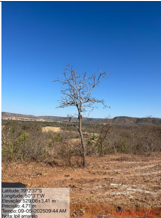
Figura 09: Foto in loco da árvore Ipê Amarelo – Handroanthus albus que não foi autorizada o corte (Arquivo pessoal, 2025).