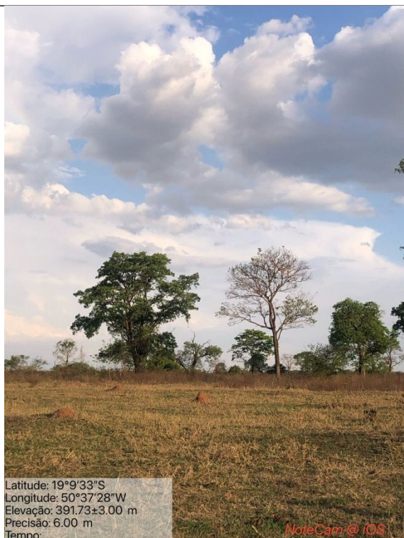
Figura 02: Foto in loco.