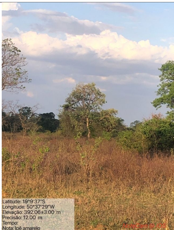
Figura 10: Foto in loco da árvore Ipê Amarelo – Handroanthus ochraceus que não foi autorizada o corte (Arquivo pessoal, 2023).