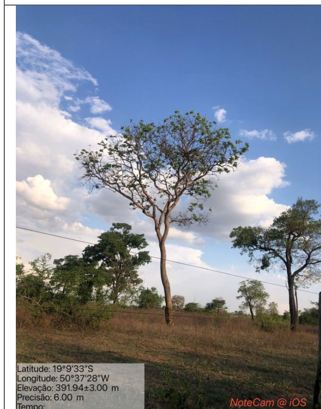
Figura 06: Foto in loco.