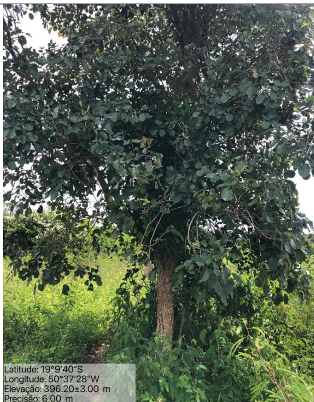
Figura 11: Foto in loco da árvore Ipê Amarelo – Handroanthus ochraceus que não foi autorizada o corte (Arquivo pessoal, 2023).