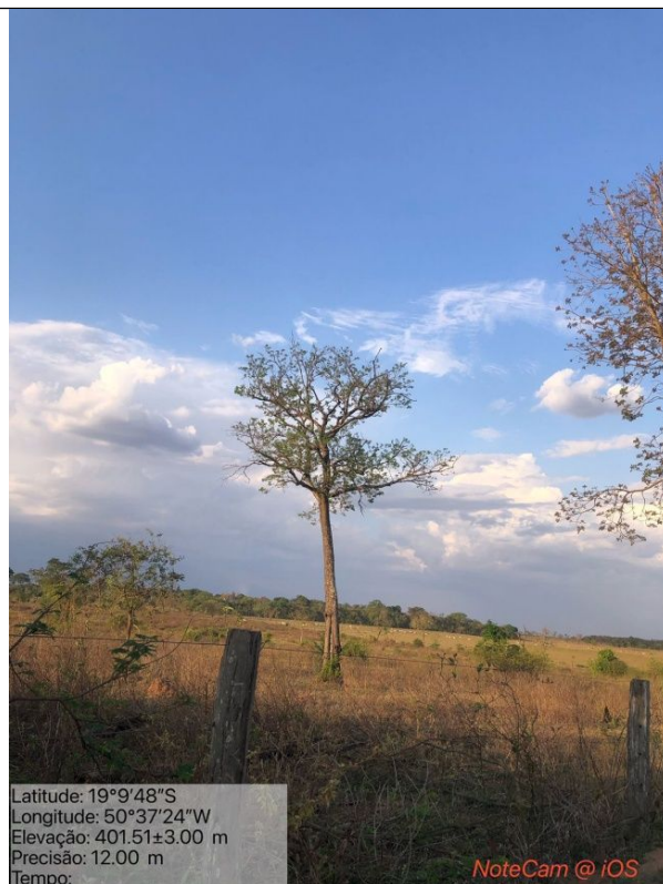
Figura 09: Foto in loco.