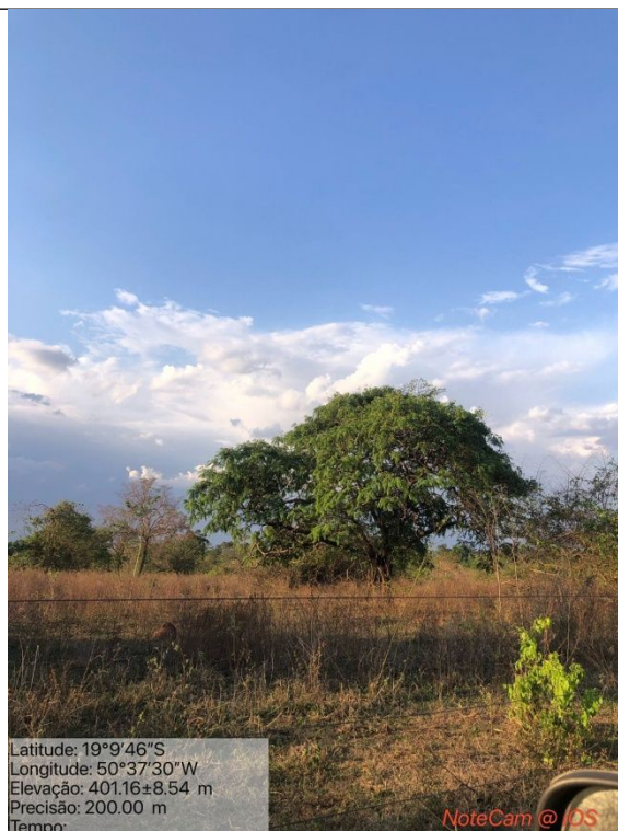
Figura 03: Foto in loco.