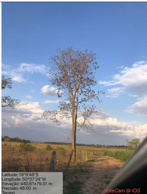
Figura 08: Foto in loco.