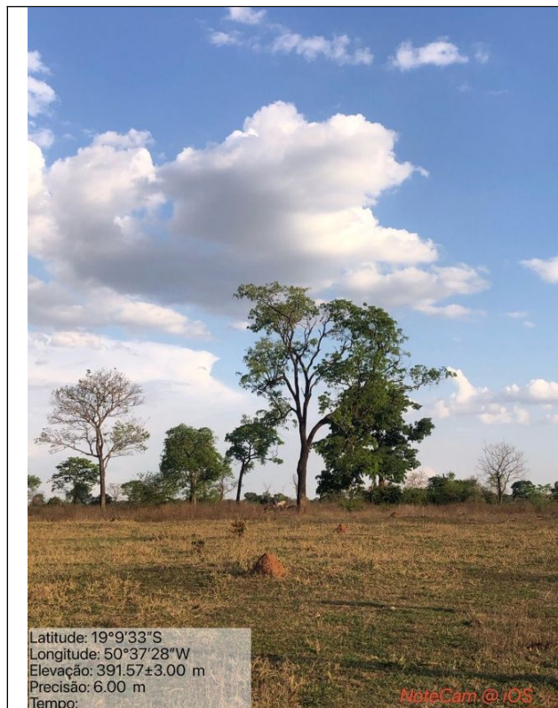
Figura 04: Foto in loco.