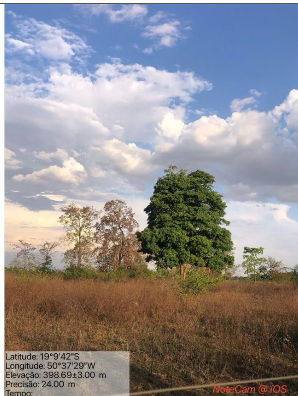
Figura 05: Foto in loco (Arquivo pessoal, 2023).