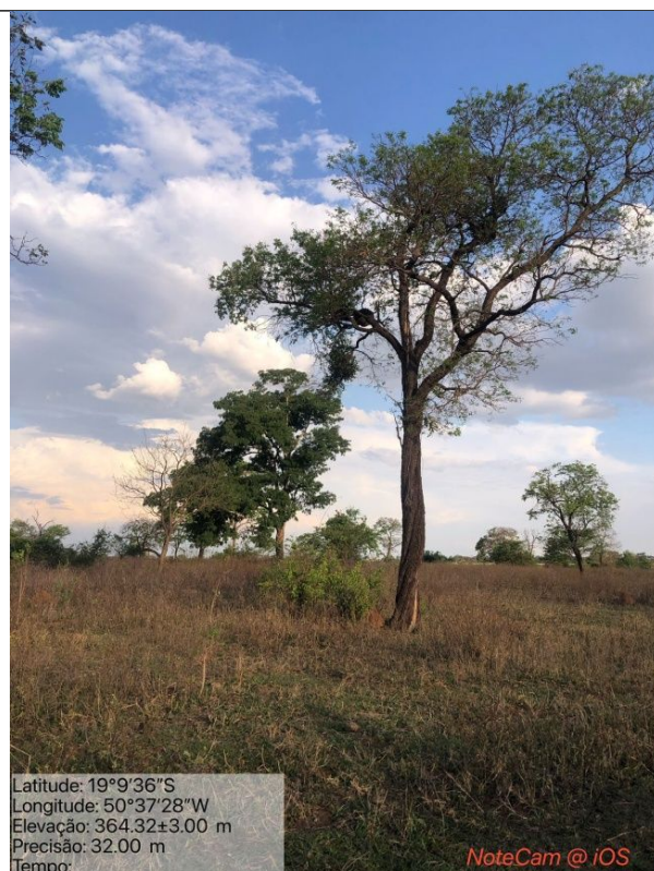
Figura 07: Foto in loco (Arquivo pessoal, 2023).